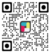
中醫藥發展基金網站

掃描QR code瀏覽中醫藥發展基金網站、追蹤Facebook和YouTube，了解更多基金資訊！